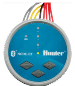
NODE-BT Durchmesser: 8,9 cm Höhe: 8,3 cm

Die Bluetooth® Wortmarke und Bluetooth® Logos sind registrierte Marken der Bluetooth SIG, Inc. iOS ist eine Marke oder registrierte Marke von Cisco Systems Inc. in den USA und weiteren Ländern. Android ist eine Marke der Google LLC. Die Nutzung dieser Marken durch Hunter Industries ist durch Lizenz gestattet.