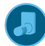
Freeze-Clik-Sensor Seite 152